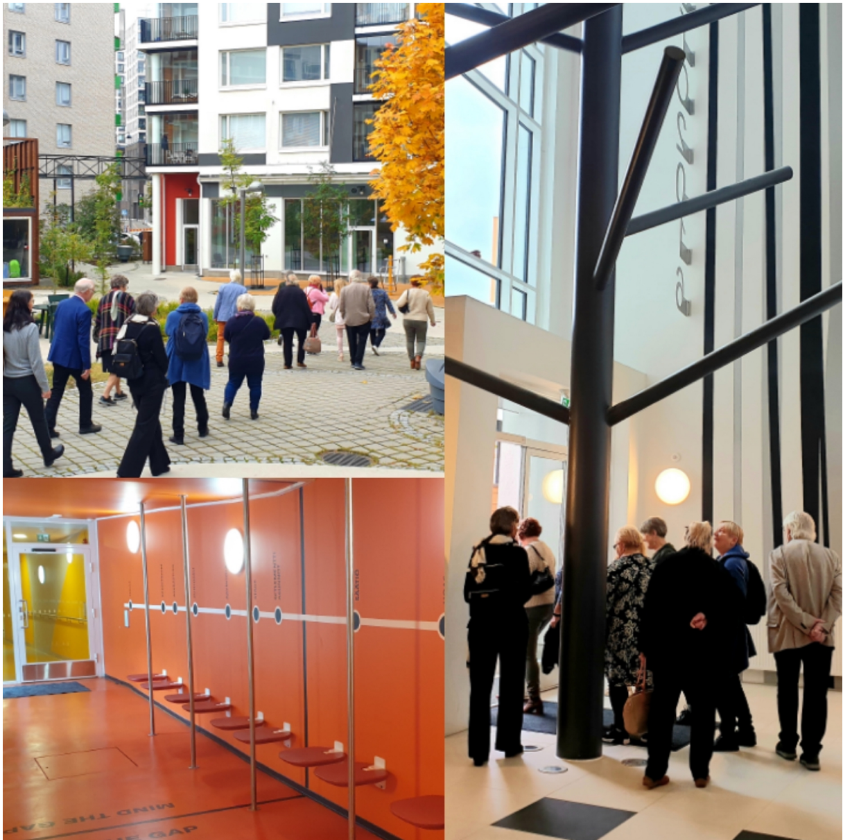
Sukupolvien kortteli, Jätkäsaari. Setlementtiasunnot Oy.