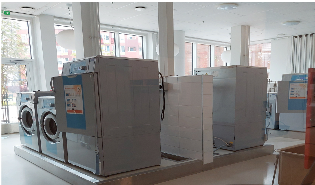
Kolmen talon yhteinen pesula on Setlementin I kerroksessa.

Korttelin yhteistilat sijaitsevat Setlementtitalon ensimmäisessä kerroksessa saunoja lukuunottamatta. Sisäntuloaulaa voidaan hyödyntää elokuvien katseluun tai esitysten pitämiseen. Yhteistiloja ovat ravintola-/kokoustila, musiikkihuone, puutyöverstas, kuntosali ja pesula. Täälläkin asukkaiden varastotilat ovat asuinkerroksissa.