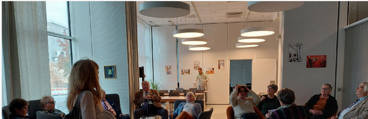
Jätkäsaaren korttelipihaa, puutyöverstas ja alla yhteistilaa. Keskellä oikealla kuva Postipuiston sisääntuloaulasta.