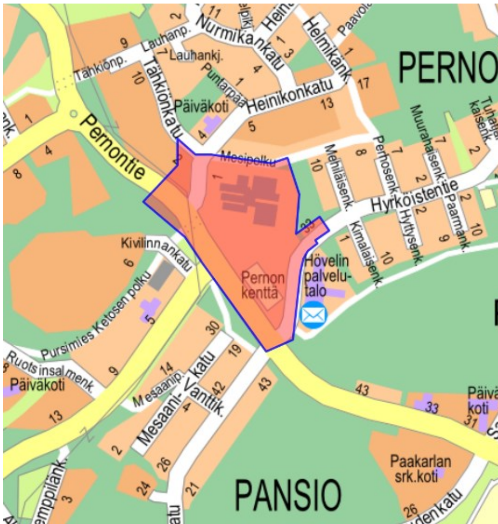
Kuva 1. Kaava-alueen sijainti.

Osoite: Hyrköistentie 33 ja 35, Heinikonkatu 1 ja 2, Pernontie 47