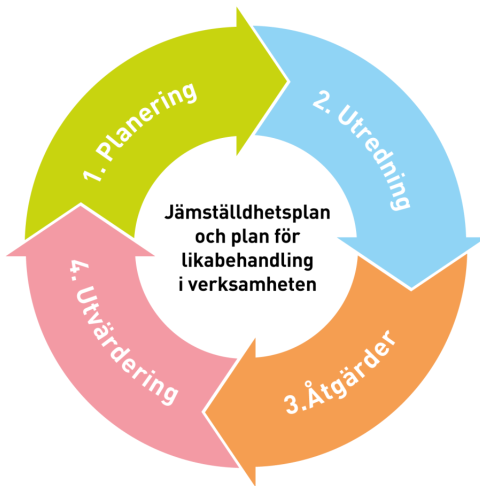
Bild 1. Processen för planering av jämställdhet och likabehandling i verksamheten inom småbarnspedagogiken och förskoleundervisningen

I småbarnspedagogikens och förskoleundervisningens vardag passar en struktur i vilken jämställdhet i vardagen utvärderas i gruppen eller enheten. Utifrån observationerna väljs ett utvecklingsområde som utvecklas under våren.