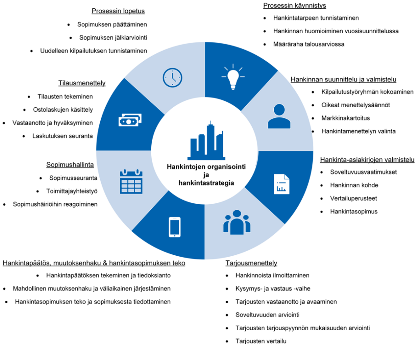
Kuvio 1. Hankintaprosessin pääpiirteet