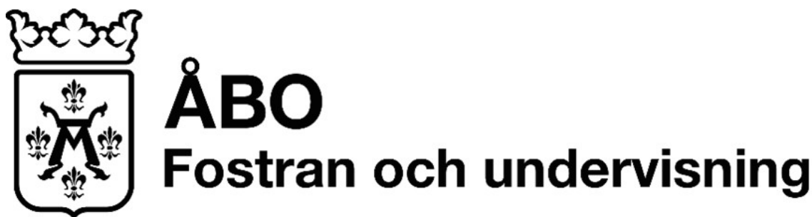
Logo Åbo Fostran och undervisning

Omsorg om byggnaden, undervisningslokaler och läromedel bidrar till en hälsosam och trygg miljö. Till främjande av trygghet hör också de förfaringssätt som gäller transporterna till och från förskolan, datasäkerheten och att förebygga olyckor. I fall förskoleundervisningen ordnas i anslutning till skolan, ska man vid undersökningar av skolmiljön och välbefinnandet även ta förskolan i beaktande.