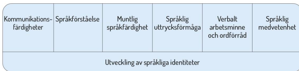
Figur 2. Språkutvecklingens centrala delområden inom småbarnspedagogiken

Med tanke på utvecklingen av kommunikationsfärdigheter är det viktigt att barnen upplever att de blir hörda och att deras initiativ blir bemötta. Det är centralt att personalen är sensitiv för och reagerar även på barnens non-verbala budskap. Utvecklingen av kommunikationsfärdigheter stöds genom att barnen uppmuntras att kommunicera med personalen och med varandra.