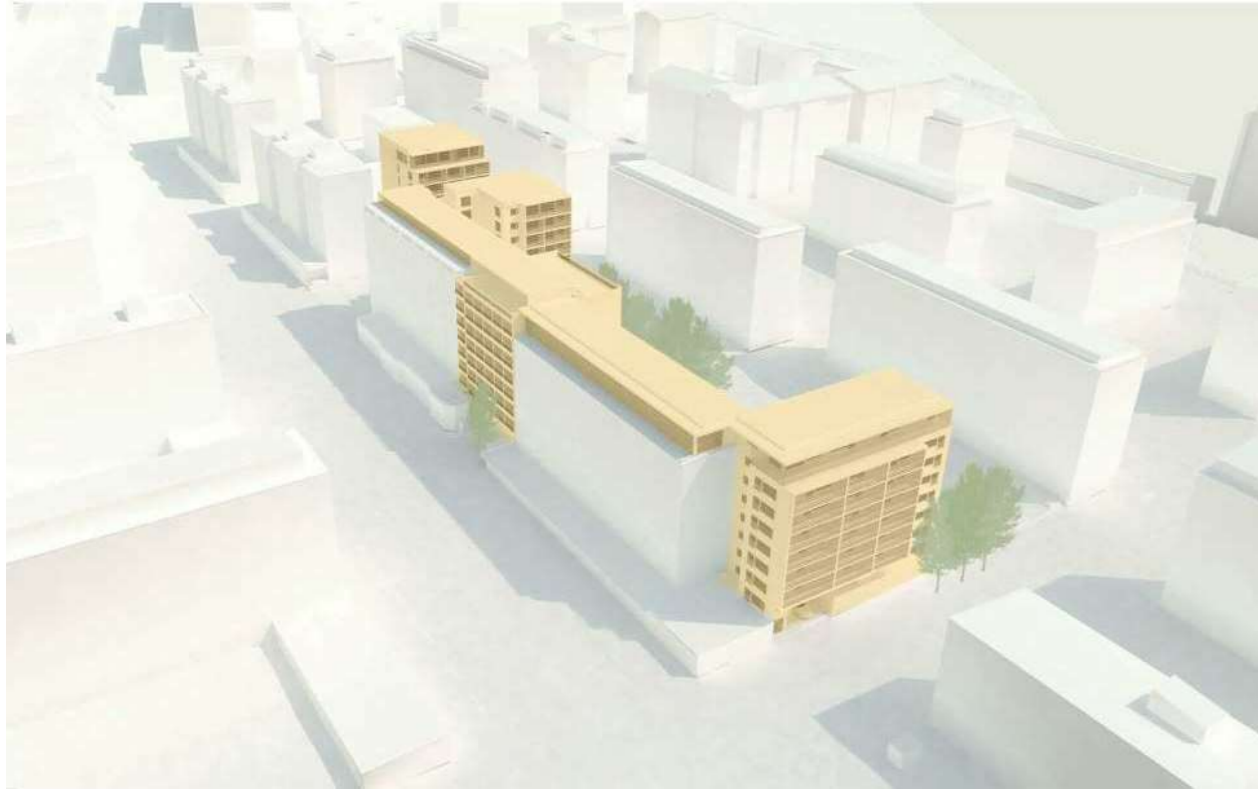
Viitesuunnitelma, Arkkitehtitoimisto Haroma&Partners Oy ja Schauman Arkkitehdit Oy