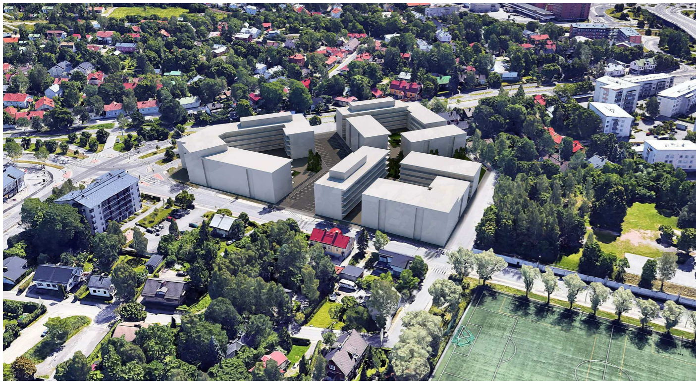
Havainnekuva / viistoilmakuvasovitus, Schauman Arkkitehdit Oy, 2.5.2019