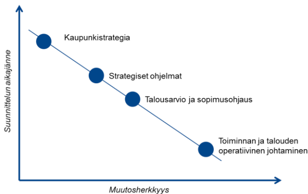
Kuva 3: Strategisen suunnittelun aikajänne ja muutosherkkyys.