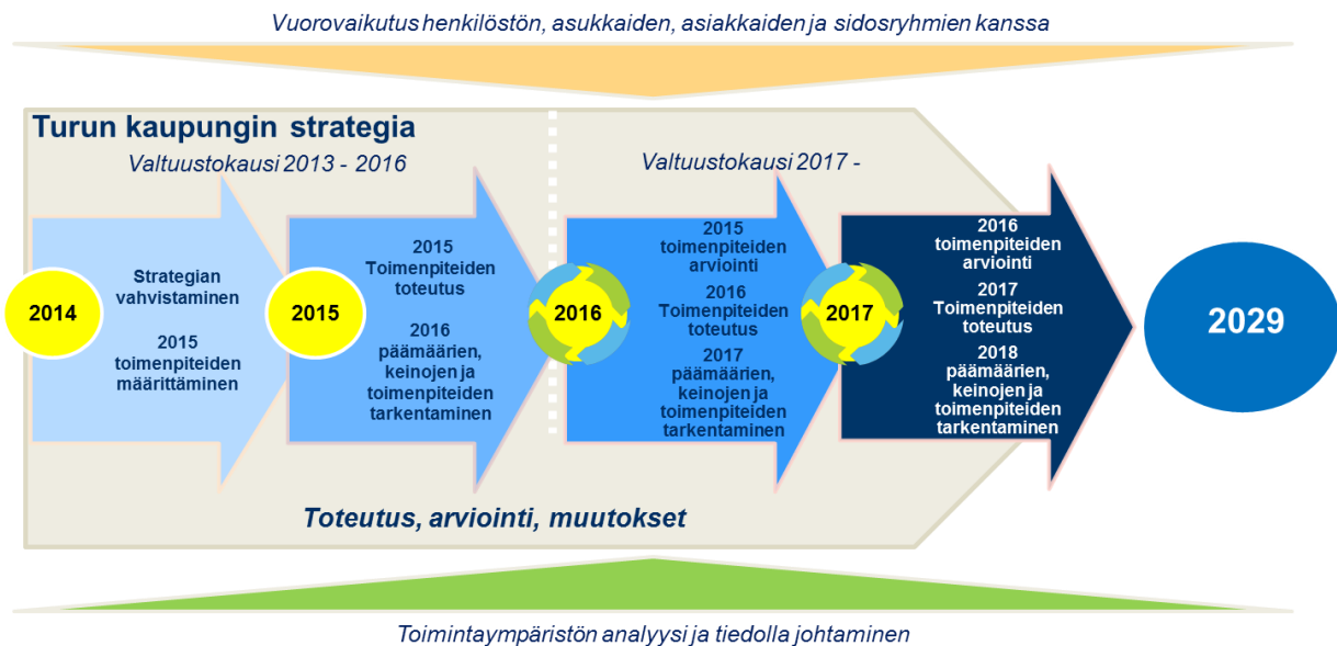
Kuva 2: Jatkuva parantaminen.

rämuotoista sovittujen toimenpiteiden toteutusta sekä saavutettujen hyötyjen arviointia. Jatkuva parantaminen etenee vuosittain toistuvana prosessina, jossa toimenpiteiden toteutus, hyötyjen arviointi sekä päämäärien, keinojen ja toimenpiteiden tarkentaminen seuraavat toisiaan. Hyötyjen arviointia tehdään tiiviissä ja avoimessa yhteistyössä kaupungin henkilöstön, asukkaiden, asiakkaiden ja sidosryhmien kanssa.