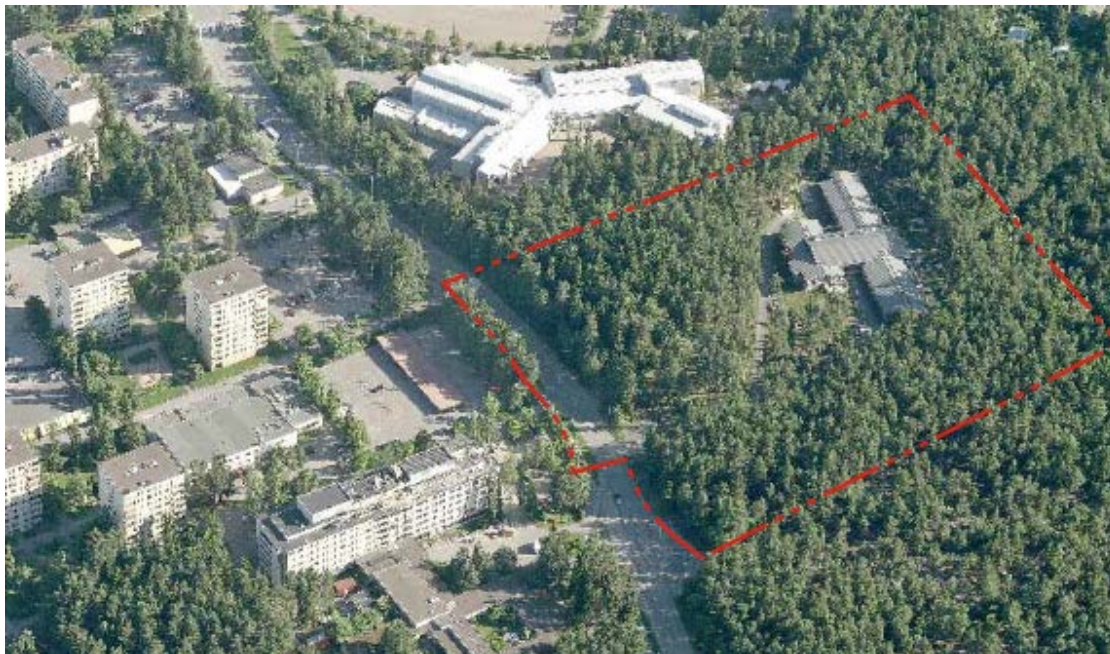
SUUNNITTELUALUE JA SEN LÄHIYMPÄRISTÖÄ ETELÄSTÄ KESÄLLÄ v. 2011