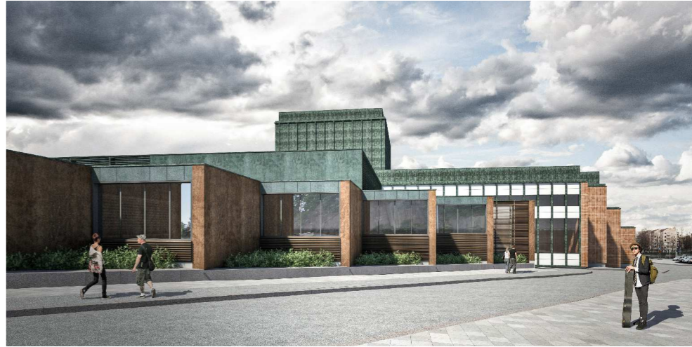
Turun Kaupunginteatteri-Näkymä Volter Kilven kadulta © LPR-arkkitehdit Oy