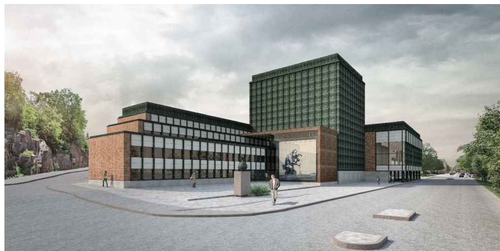
Turun Kaupunginteatteri-Näkymä Teatterisillalta © LPR-arkkitehdit Oy