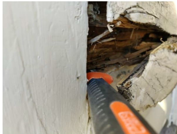
Kuva 28. Hirsissä havaittiin merkittäviä lahovaurioita ympäri taloa.