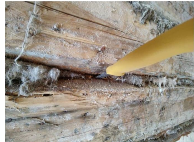
Kuva 50. Väliseinähirsien tilkeväleissä on lahoa ja merkittäviä mikrobivaurioita, joita on käytännössä mahdoton korjata ilman rakenteiden laajempaa purkamista.