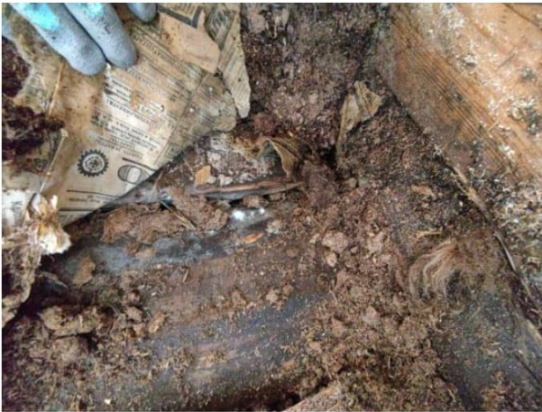
Kuva 11. Rakenneavaus keittiötilassa. Alapohjan kaikki rakennekerrokset ovat kastuneet. Rakenteessa on aktiivista mikrobikasvustoa ja lahoa.