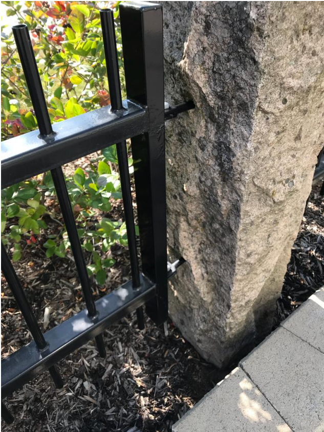
Kuva 2 (alkuperäinen aita)