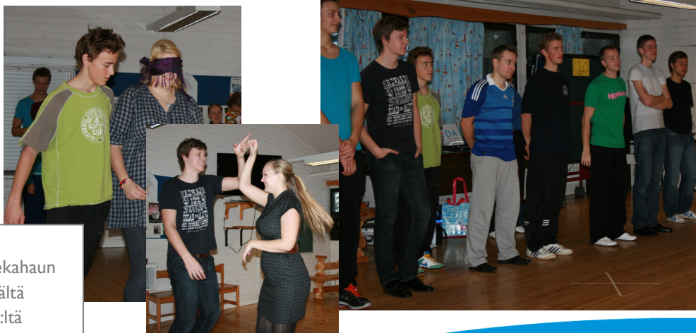
Kuvia turkulaisen Lavatanssiseura Sekahaun nuorten järjestämästä DanceCamp 2010:ltä

Euroopan Kulttuuripääkaupunki -vuosi 2011 on täynnä erilaisia tapahtumia, joissa mahdollisesti halukkaat nuoret voivat olla mukana toteuttamassa liikuntatapahtumia.