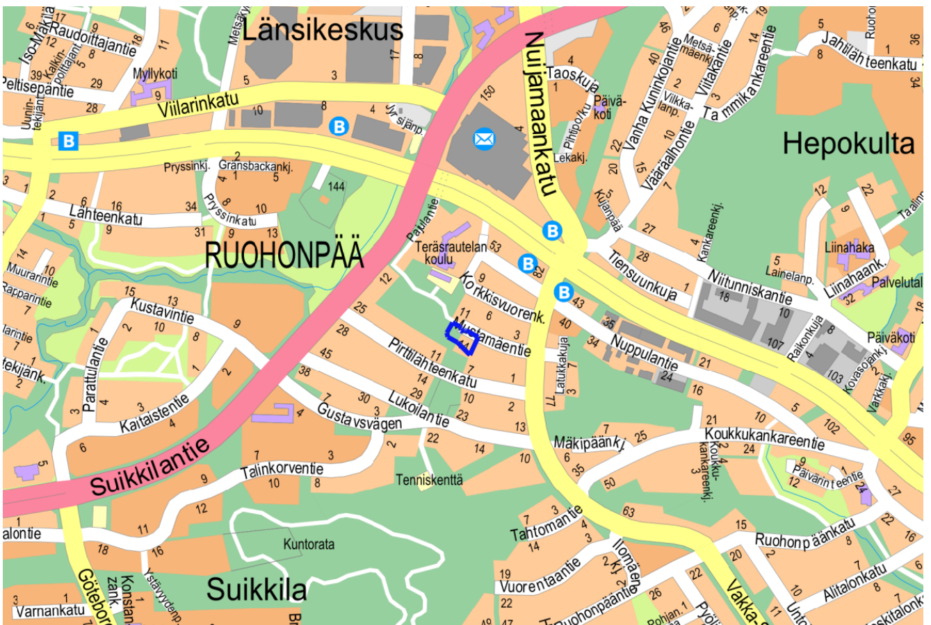
Kuva 1. Kaava-alueen sijainti.

Kaupunginosa: Ruohonpää 075 Osoite: Mustamäentie 14 ja 16