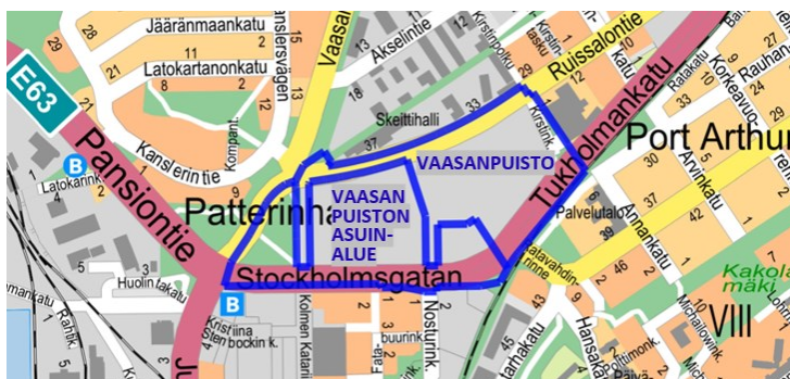
Kuva 2. Vaasanpuiston asuinalueen ja Vaasanpuiston kaavarajaukset.

Kaavamuutosalue oli alun perin osa Vaasanpuiston kaavamuutosaluetta, joka jaettiin helmikuussa 2025 kahteen osaan. Toisen osan työnimenä säilyi Vaasanpuisto. Jako on esitetty kuvassa 2. Jakamisella varmistetaan, että Linnakaupungin monitoimitalon edellyttämä kaavamuutos valmistuu rakennuksen toteutuksen vaatimassa aikataulussa.