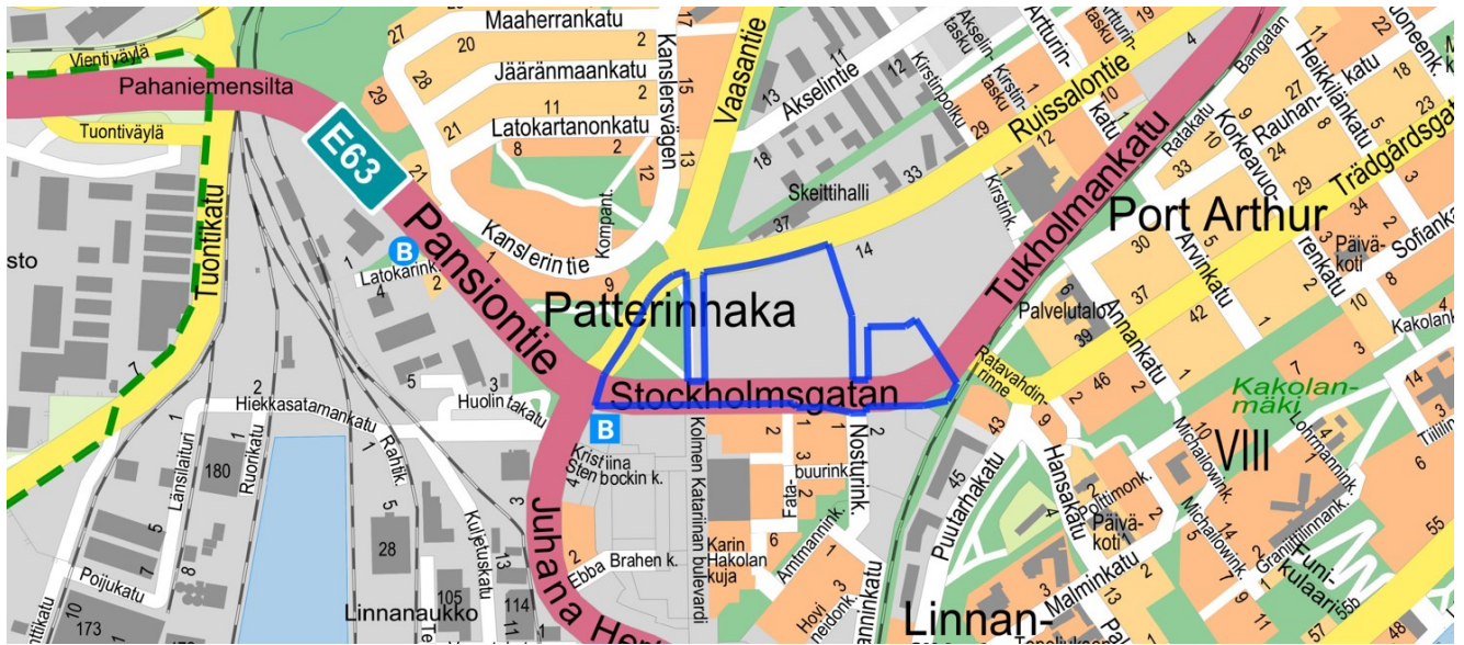
Kuva 1. Kaava-alueen sijainti.

Kaupunginosa: Iso-Heikkilä Osoite: Ruissalontie 14