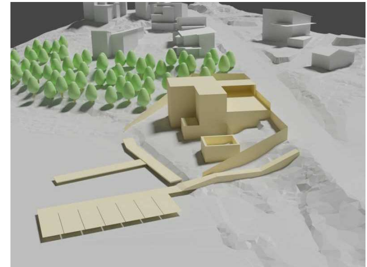
HAVAINNEKUVA © Turun kaupunki (tekijä: Miro Pietilä)

Till denna detaljplanekarta hör en beskrivning där uppgifter om planens utgångspunkter och mål, motiveringar till planlösningen samt en redogörelse av detaljplanen och dess verkningar ingår.