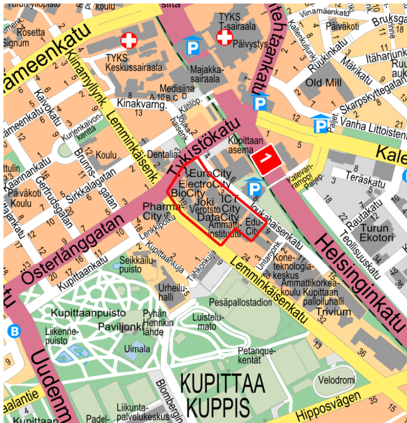
Kuva 1. Kaava-alueen sijainti opaskartalla.

Asemakaavanmuutos laaditaan kartassa rajauksella osoitetulle alueelle, joka sijaitsee Kupittaa kaupunginosassa noin 1,3 kilometrin etäisyydellä Kauppatorilta kaakkoon.