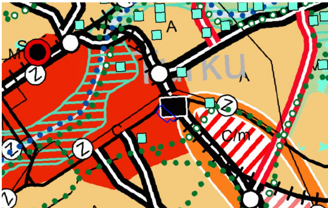
Kuva 2. Ote maakuntakaavayhdistelmästä.

Suunnittelumääräyksen mukaan maankäytön, kestävän liikkumisen, asumisen, palvelujen ja työpaikkatoimintojen yhteensovittavaa kehittämistä tulee edistää kokonaisvaltaisella suunnittelulla. Suunnittelun tulee olla kaupunki- ja taajamakuva eheyttävää ja ominaispiirteet huomioivaa. Suunnittelulla tulee varmistaa seudullisesti merkittävän vähittäiskaupan edellytykset olemassa olevia rakenteita kehittämällä.