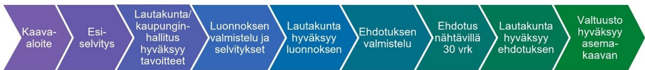
XL-kokoisen kaavan prosessi

Esiselvitysvaiheessa tämä hanke on arvioitu luokkaan XL. Arvio kaavoituksen kestosta on XL-kaavalla vähintään kolme vuotta.