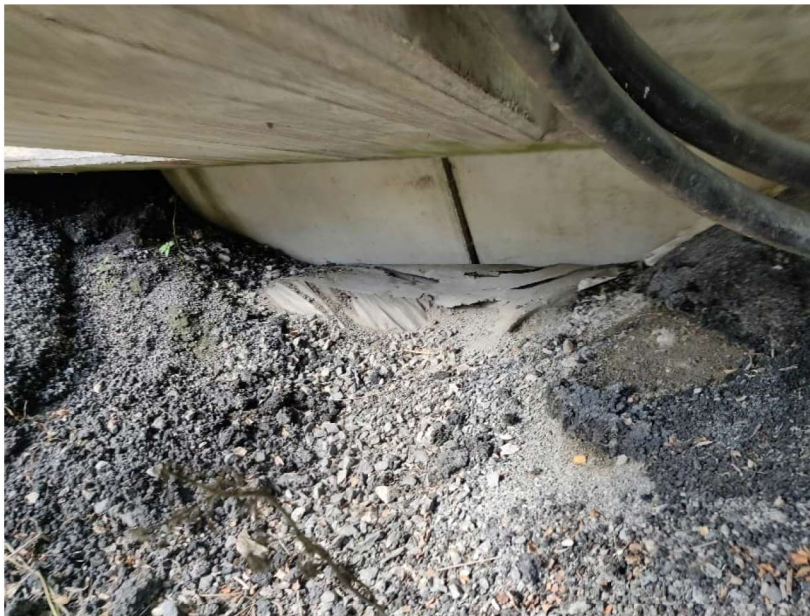
Kuva 3: Kuva päätypenkereen painuma/erosiovauriosta (YT 2023)