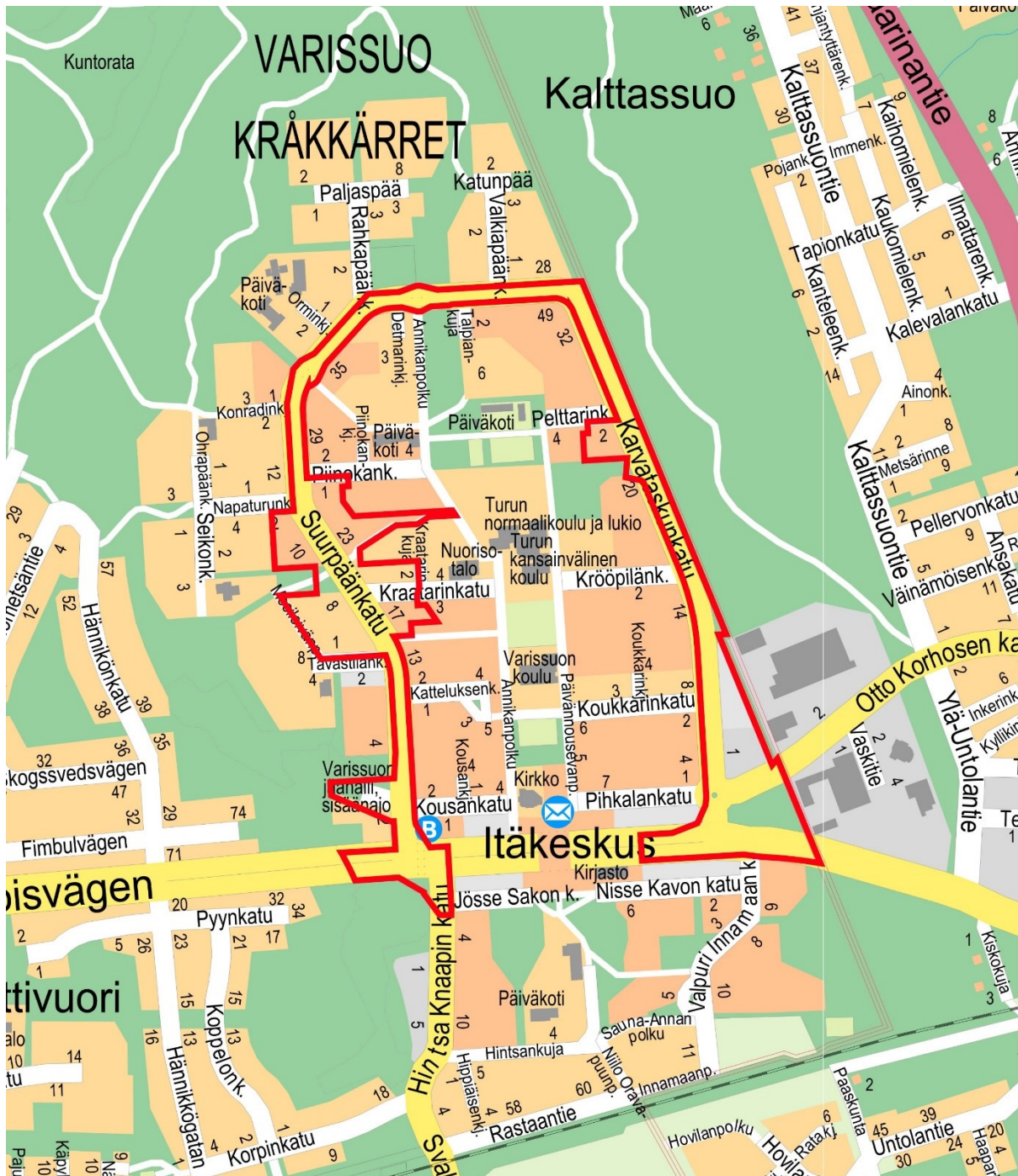
Sijaintikartta. © Turun kaupunki

Tämä esiselvitys koskee kaupungin omaa aloitetta asemakaavanmuutoksen laatimisesta. Esiselvitys antaa tiedon siitä, onko aloitteella edellytyksiä edetä asemakaavoitukseen. Kaavoituksen käynnistäminen kuuluu kaupungin harkintavaltaan.