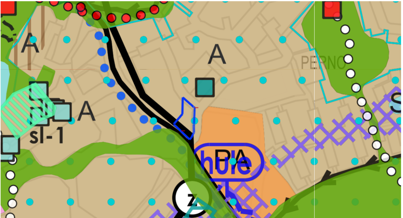
Kuva 2. Ote Yleiskaavasta 2029.

Asemakaavassa 853 8/1976 (tullut voimaan 26.03.1977) alue on määritelty liike- ja autopaikkarakennusten korttelialue, jolle saa sijoittaa autopaikkoja AK1- korttelialueen käyttöön kaavamerkinnällä ALA1. Tontin rakennusoikeus on 500 k-m 2 ja suurin sallittu kerrosluku on yksi. Tontin lounaisreunalla kulkee noin 24 metriä leveä voimansiirtoalue.