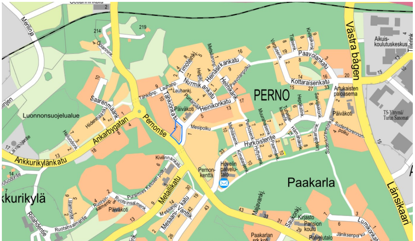
Kuva 1. Kaava-alueen sijainti.

Kaupunginosa: Perno Osoite: Heinikonkatu 2