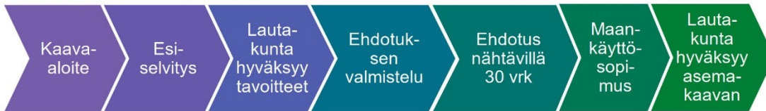
M-kokoisen kaavan prosessi

Osallisia kaavan valmistelussa ovat alueen maanomistajat ja ne, joiden asumiseen, työntekoon ja muihin oloihin kaava saattaa huomattavasti vaikuttaa, sekä viranomaiset ja yhteisöt, joiden toimialaa suunnittelussa käsitellään. Tämän hankkeen osalta osallisiksi on arvioitu seuraavat tahot: