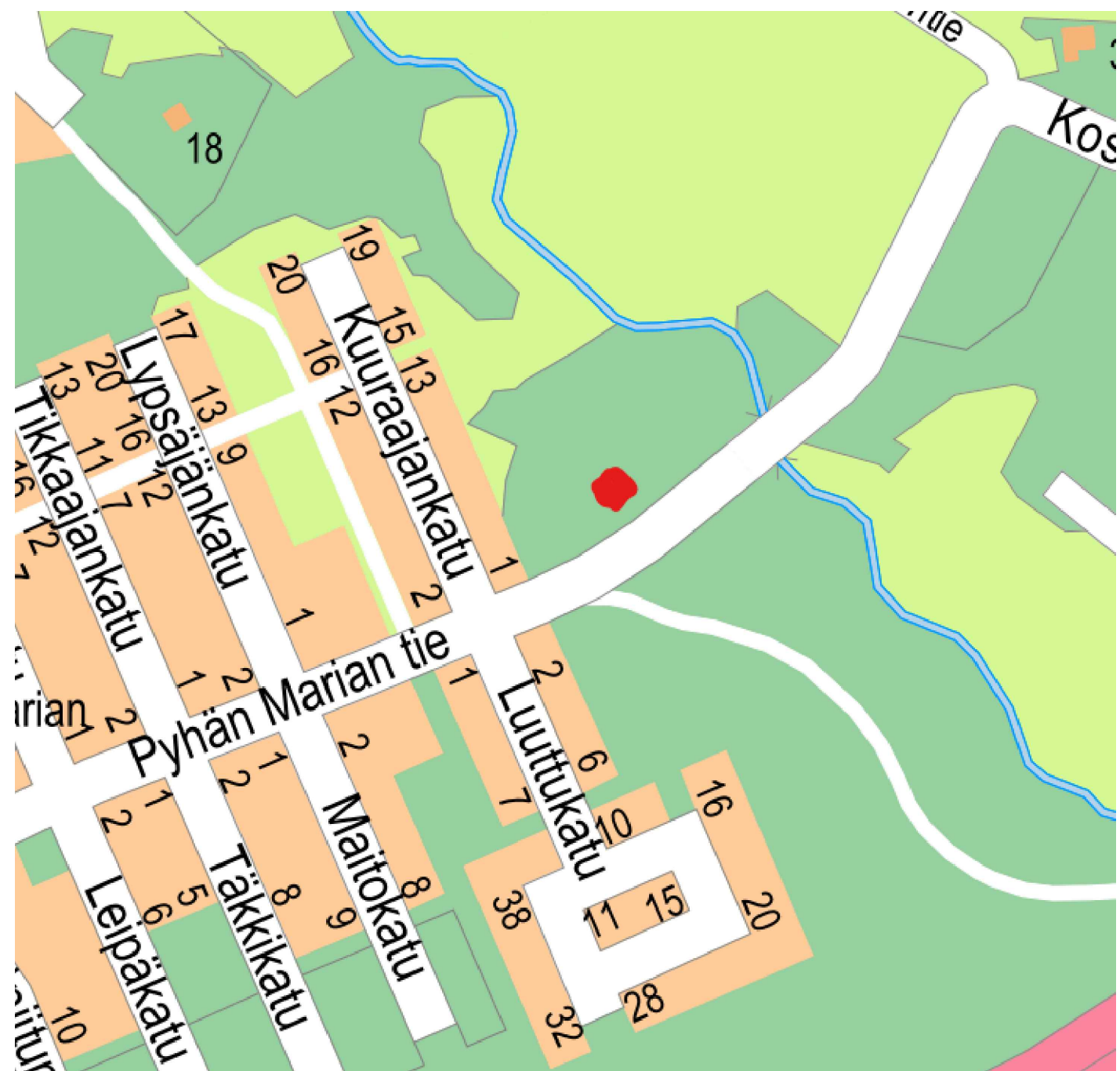
1:1000 / Asemapiirros / Turun kaupunki, numeerinen aineisto (kantakartta).