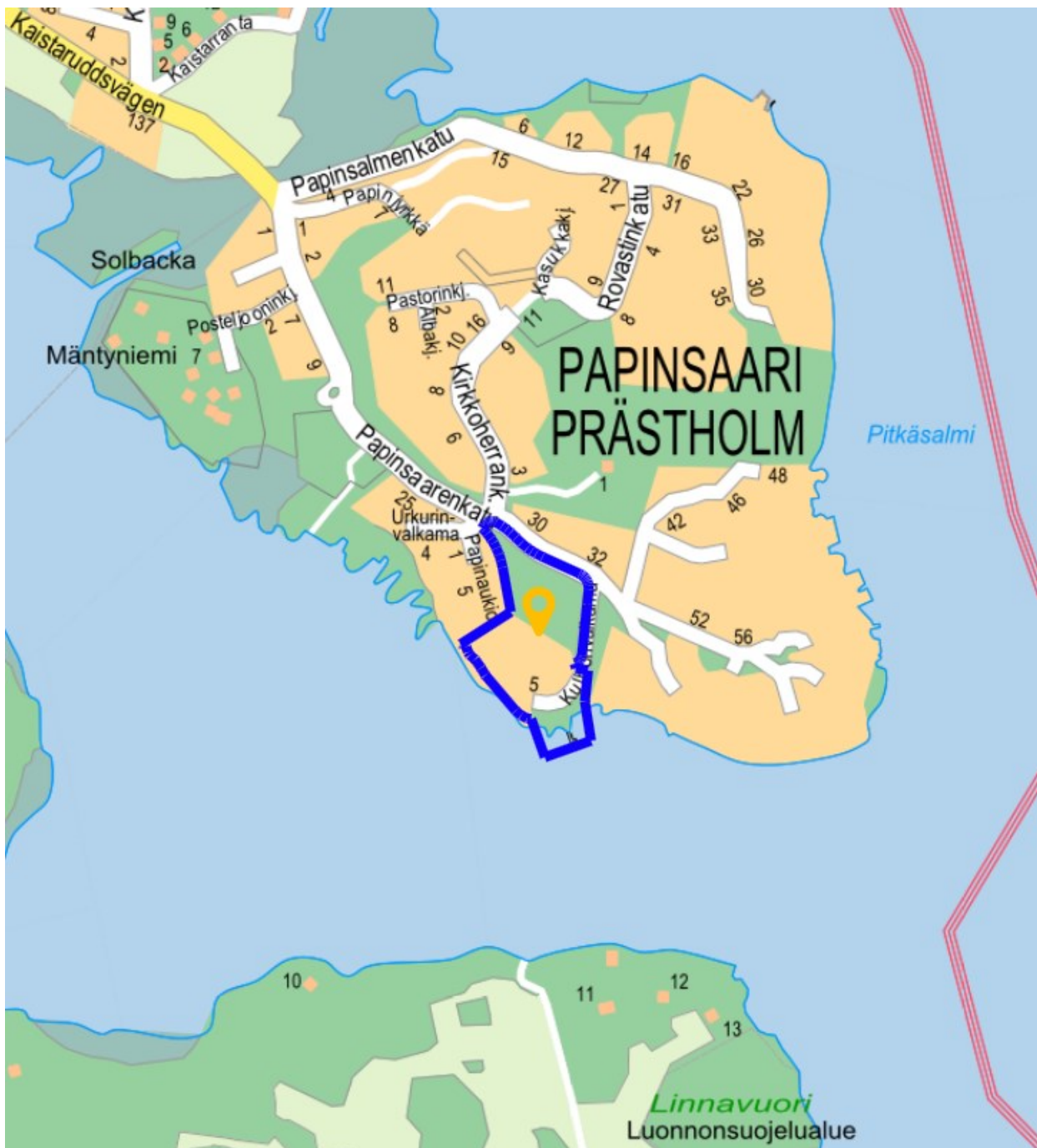
Kuva 1. Kaava-alueen sijainti.

Osoite: Papinsaarenkatu ja Kulhonvalkama