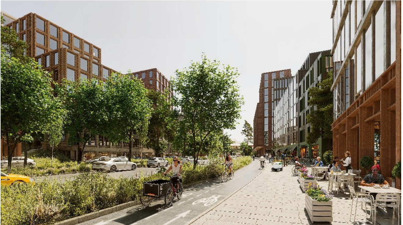
Kuva 3. Havainnekuva uudistuvalla Helsinginkadulla © Turun kaupunki ja Lundén Architecture Company

sopivia kiertotalouden keinoja sekä edistämällä Turun kaupunkistrategian hiilineutraaliuden ja luonnon monimuotoisuuden tavoitteita. Suunnittelualueen uudisrakentamisessa tavoitellaan rakennuksen koko elinkaaren huomioivia kestäviä teknisiä ratkaisuja ja materiaaleja sekä rakennusten pitkäikäisyyttä ja muuntojoustavuutta. Kaupunkiluontoympäristön merkitys korostuu Kupittaa ja Itäharjun alueilla, sillä suunniteltu kaupunkirakenne tulee muodostumaan tiiviiksi. Turun Tiedepuiston tavoitteeksi on asetettu alueen käyttäjien arkeen nivoutuvat hyvinvointia ja terveyttä edistävät alustat, ratkaisut ja palvelut. Hyvinvoinnin tavoitetta tarkastellaan ihmisen lisäksi myös muiden lajien näkökulmasta.