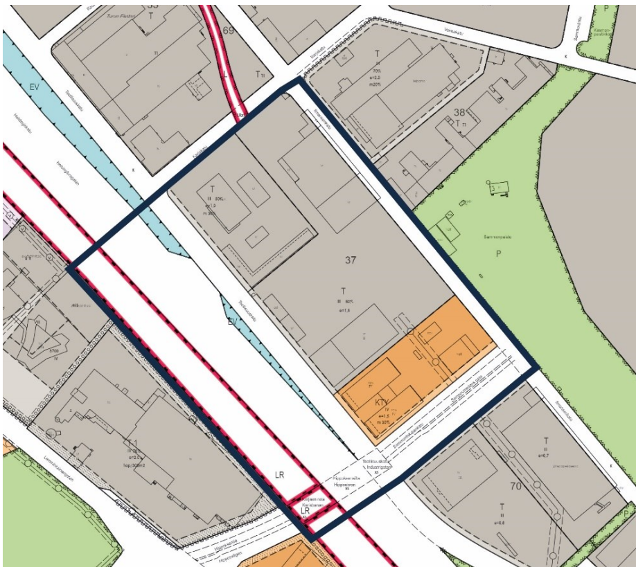
Kuva 4. Ote ajantasa-asemakaavasta ja kaavarajaus.

Voimassa olevassa asemakaavassa suunnittelualueen isoimmat tontit ovat teollisuus- ja varastorakennusten korttelialuetta (T). Sammontakojankadun varren pienemmät tontit ovat liike- ja toimistorakennusten sekä ympäristöhäiriöitä aiheuttamattomien teollisuusrakennusten korttelialuetta (KTY). Teollisuuskadun ja Helsinginkadun välissä on suojaviheraluetta (EV).