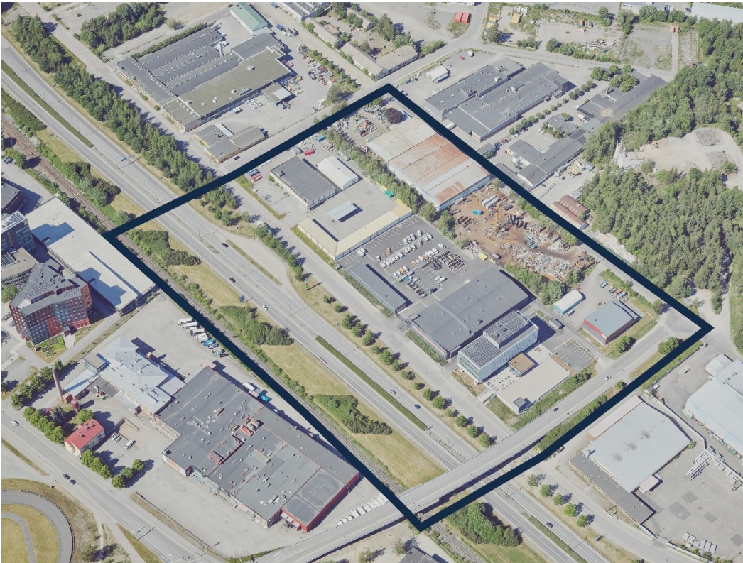
Kuva 2. Kaava-alueen rajaus ilmakuvassa.

Suunnittelualueella toimii tällä hetkellä yrityksiä kuten mm. Turku Energia ja lasitusliike. Tontit ovat yhtä lukuun ottamatta kaupungin omistamia.