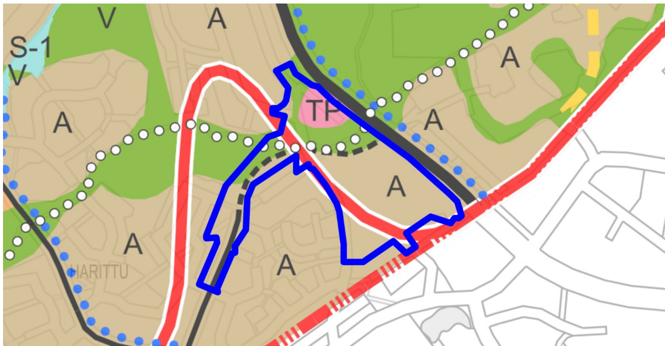
Kuva 2. Ote yleiskaavan 2029 kartasta 1: yhdyskuntarakenne.

vyöhykettä. Alueen halki kulkee itä-länsisuunnassa ulkoilureitti, sijainniltaan ohjeellinen väylälinjaus, 110–400 kV sähkölinja sekä säilytettävä ja vahvistettava ekologinen yhteys. Lisäksi alueen itäosat on määritelty pohjavesialueeksi ja hulevesien hallinnan toimenpidealueeksi. Kaarningon pumppaamo määritelty arvokkaaksi rakennukseksi.