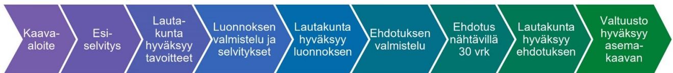
XL-kokoisen kaavan prosessi

Osallisia kaavan valmistelussa ovat alueen maanomistajat ja ne, joiden asumiseen, työntekoon ja muihin oloihin kaava saattaa huomattavasti vaikuttaa, sekä viranomaiset ja yhteisöt, joiden toimialaa suunnittelussa käsitellään. Tämän hankkeen osalta osallisiksi on arvioitu seuraavat tahot: