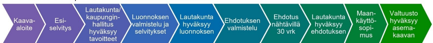
XL-kokoisen kaavan prosessi

Esiselvitysvaiheessa tämä hanke on arvioitu luokkaan XL. Kaava sisällytetään kaavoitusohjelmaan. Arvio kaavoituksen kestosta on XL-kaavalla vähintään kolme vuotta.