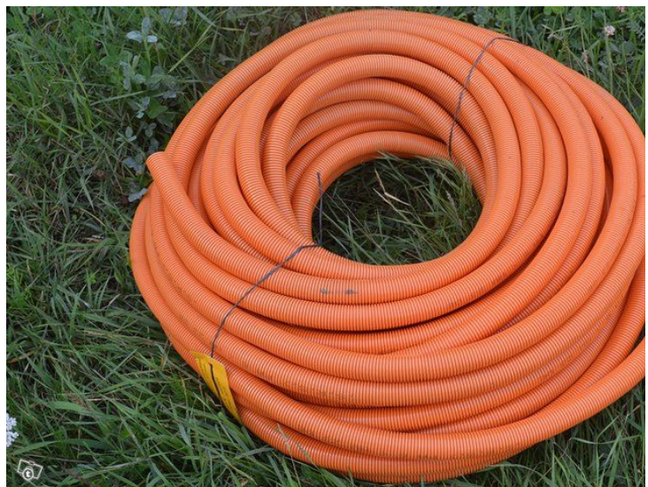
Esimerkkejä teoksen hyödynnettävästä kierrätysmateriaalista.