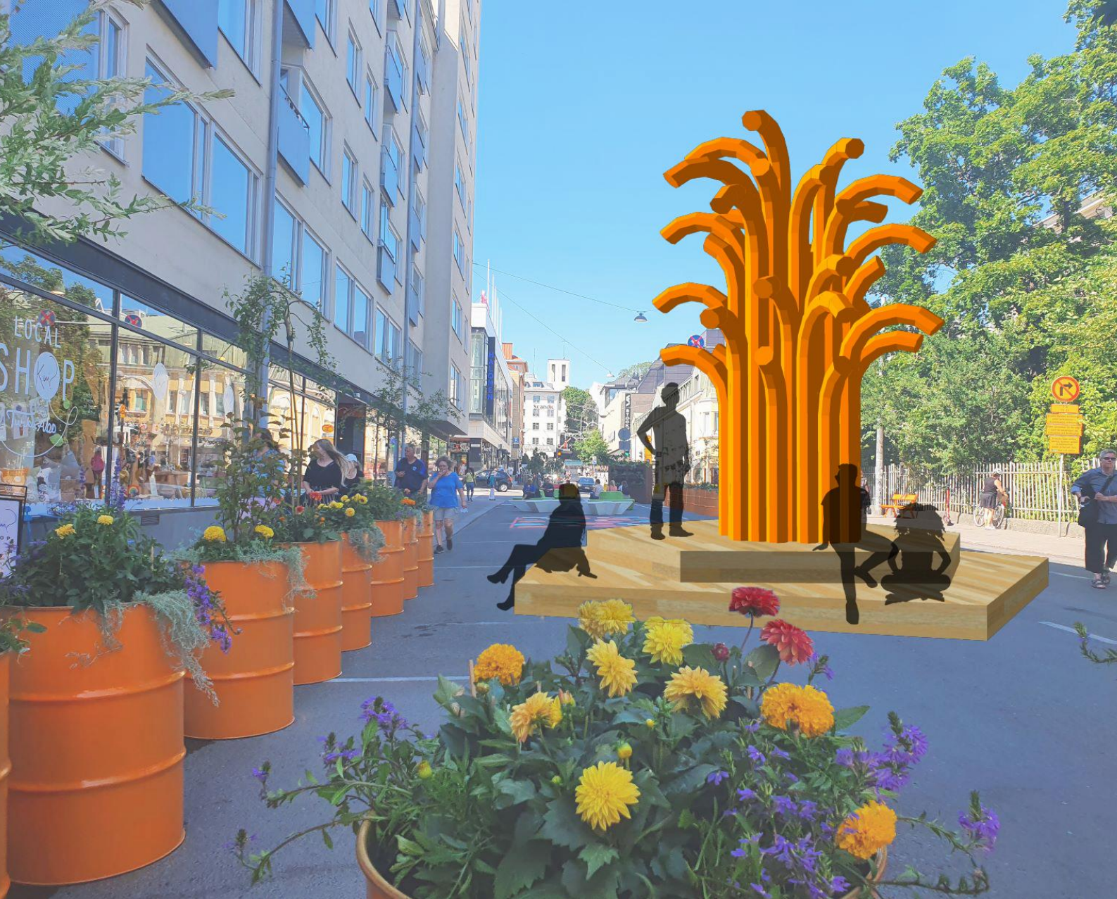
Alustava konseptikuva Rakkauskirjeitä merelle-teoksesta Turun Kesäkadulla.