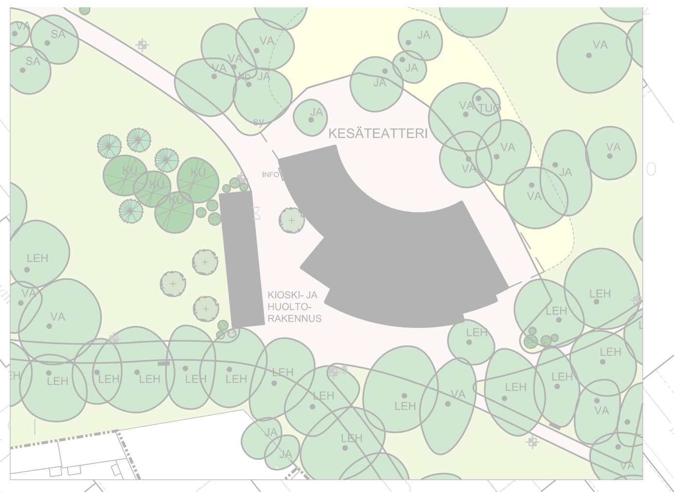
EHDOTUS KESÄTEATTERIN JA VIHERRIIKELAITOKSEN MAHDOLLISEN UUDEN KIOSKI- JA HUOLTORAKENNUKSEN SIIJOTTUMISESTA VARTIOVUOREN PUUSTOON 1:500