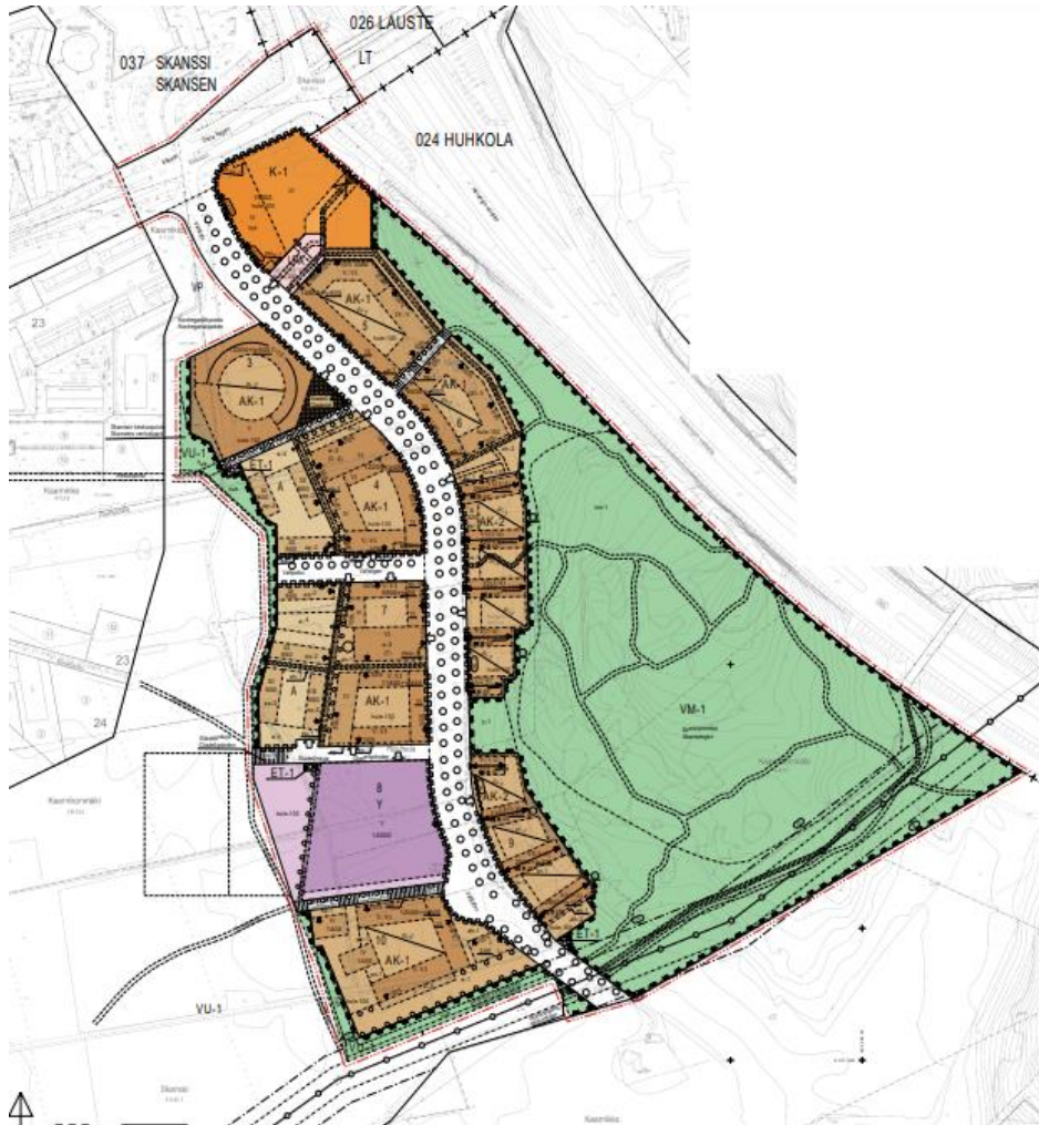
Kuva 1 Itä-Skanssin asemakaava-alue

Kaduista laaditaan Turun kaupungin ohjeiden mukaiset katusuunnitelma piirustukset ja katusuunnitelmaselostus. Pohjanvahvistuslausunto laaditaan lukuun ottamatta Vallikatua, jolle lausunto ja rakennussuunnitelmat on laadittu aiemmin. Pohjanvahvistuslausunto sisältää painuma- ja stabiliteettilaskelmat, arvion pohjanvahvistustoimenpiteistä. Pohjanvahvistuslausunto laaditaan olemassa olevien tutkimusten perusteella.