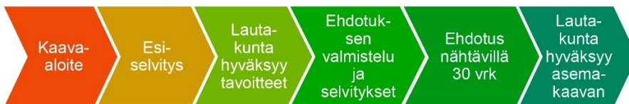
M-kokoisen kaavan prosessi

Kaavan aloitusajankohta tarkastellaan kaavoitusohjelman yhteydessä. Arvio kaavoituksen kestosta on M-kaavalla n. 1,5 vuotta.