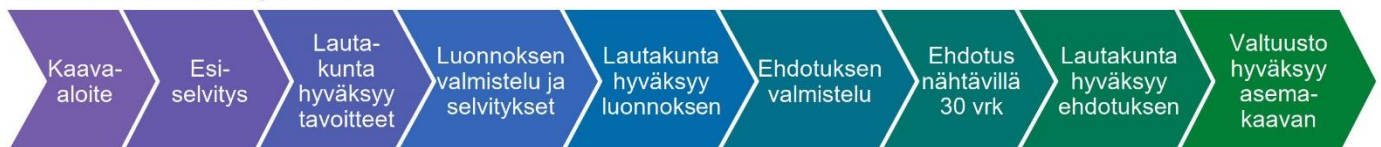
XL-kokoisen kaavan prosessi

Esiselvitysvaiheessa tämä hanke on arvioitu luokkaan XL. Kaava sisällytetään kaavoitusohjelmaan. Arvio kaavoituksen kestosta on XL-kaavalla vähintään kolme vuotta.