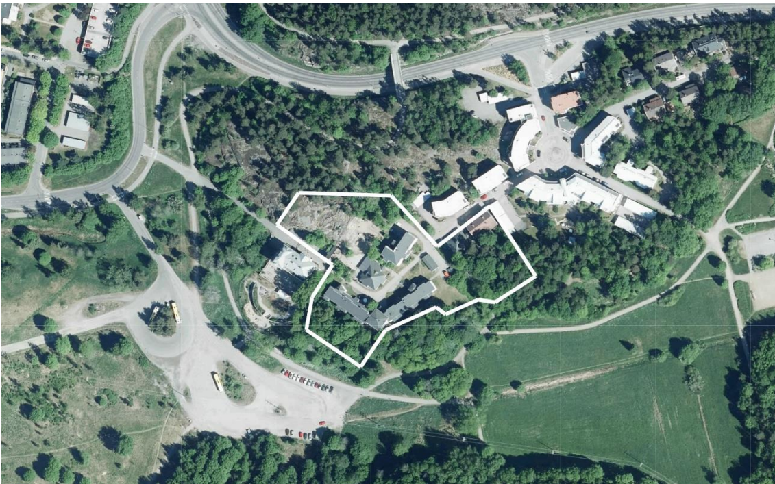
Kuva 2. Ilmakuva. Jagellonicankatu 3 ja 4 on rajattu valkoisella viivalla.