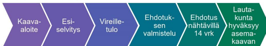
S-kokoisen kaavan prosessi

Esiselvitysvaiheessa tämä hanke on arvioitu luokkaan S. Tavoitteena on, että kaavan valmisteluprosessi alkaa kuuden kuukauden kuluessa esiselvityksen hyväksymisestä. Arvio kaavoituksen kestosta on S-kaavalla yksi vuosi.