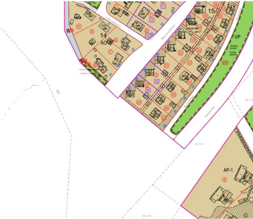
Ote ajantasaisesta asemakaavasta.

Kaupunkiympäristö Kaupunkisuunnittelu ja maaomaisuus Kaavoitus