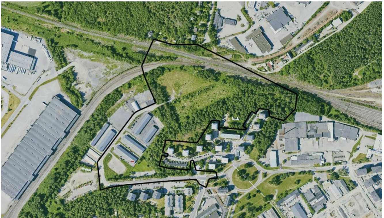
Kuva 3. Kaavanmuutosalueen alustava rajaus merkittynä ilmapäivitykseen vuodelta 2022.