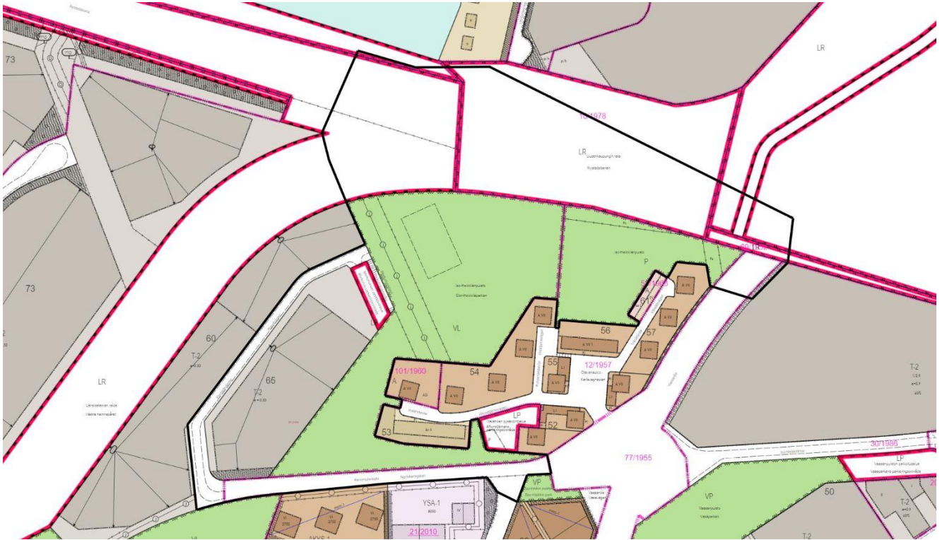
Kuva 2. Kaavanmuutosalueen alustava rajaus merkittynä ajantasa-asemakaavaan.

Kaupunkiympäristö Kaupunkisuunnittelu ja maaomaisuus Kaavoitus