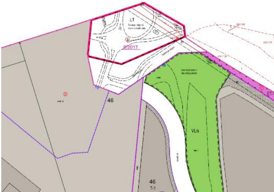
Ote ajantasaisesta asemakaavasta.

Kaupunkiympäristö Kaupunkisuunnittelu ja maaomaisuus Kaavoitus