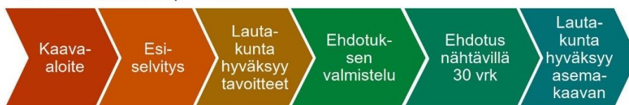
M-kokoisen kaavan prosessi

Esiselvitysvaiheessa tämä hanke on arvioitu luokkaan M. Kaavan aloitusajankohta arvioidaan vuosittain syksyllä laadittavan kaavoitusohjelman yhteydessä. Arvio kaavoituksen kestosta on M-kaavalla n. 1,5 vuotta.