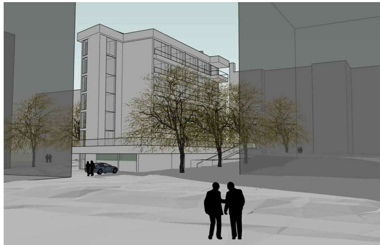
Havainnekuva uudesta kerrostalosta Kaskenkadun puolelta Arosuo Arkkitehdit Oy 15.11.2022