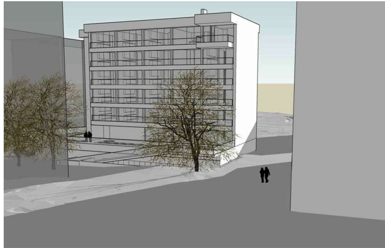
Havainnekuva uudesta kerrostalosta Luostarinkadun puolelta Arosuo Arkkitehdit Oy 15.11.2022