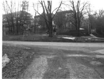
Patriankadun ja Vatselankadun risteys

Perusidea piti olla kävelyn ja pyöräilyn erottaminen omille väylille, mikä tässä perussuunnitelmassa on ainoa hyvä osa. Mutta koko juttu on sotkettu peltilehmien paapomisella pyöräkadulla ns. asiakaspysäköinnein sielä sun täällä sekä syrjimällä kävelijöitä älyttömillä ja turvattomuutta lisäävillä ratkaisuilla.