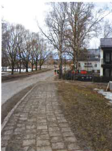
Vatselankadun jalkakäytävä Rehtorinpellonkadulta

Perusteluna on kuulema vähäinen käyttö. Voi vittu! Esimerkiksi minä käytän sitä joka päivä ja tapaan jatkuvasti alueen asukkaita sillä jalkakäytävällä. Sitä käyttävät pääasiassa alueen asukkaat, mutta myös yliopistolle tai ylioppilaskylään kävelijät sekä kuppakorkeakoulun "kerhotilaan" (Parkinkatu 6) kävelevät. Alueen asukkaiden turvallisuudella ei siis näytä olevan mitään merkitystä, kun kaupunki kehittää "pyöräilykaupunkia". Esimerkiksi Parkinkadulla asuu runsaasti ikäihmisiä ja lapsiperheitä, joiden pitäisi siis ylittää vilkasliikenteinen Vatselankatu (ilman suojatietä ja luiskia), pyöräilijöiden alamäessä ja huonon näkyvyyden kulmassa. Parkinkatu 1:n/Vatselankatu 5:n portti sijaitsee Vatselankadun puolella ja johtaisi siis jatkossa suoraan pyöräkadulle, jos jalkakäytävä poistetaan. Siinä on kivaa mennä rollaattorilla tai lastenvaunuilla, koska jalkakäytävälle sinne toiselle puolelle ei edes pääse, koska ei ole suojatietä/luiskaa.