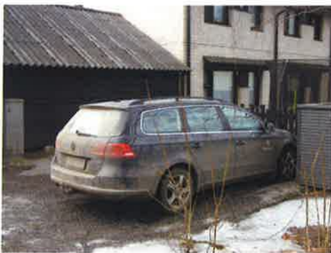
Patrianpuisto. Parkinkatu 2/4.

Laittomassa aidassa oleva kyltti suurennettu.