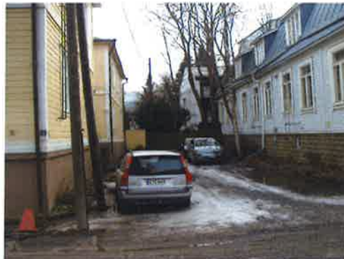
Patrianpuisto. Parkinkatu 1/3.

Laittomassa aidassa oleva kyltti suurennettu.