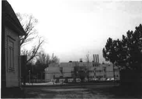
Parkinkadun ja Vatselankadun risteys

Jos jalkakäytävä ja korotettu suojatie Rehtorinpellonkadulta poistetaan, Patriankadulta kävelevät joutuvat käytännössä suoraan Vatselankadun, Rehtorinpellon ja Vesilinnankadun risteysalueelle. Parkinkadulta on hankalaa päästä toiselle puolelle, koska näkyvyys on heikko, ei ole (korotettua) suojatietä eikä luiskia. Suunnitelma tulee johtamaan ennen kaikkea pyöräilijöiden ja kävelijöiden välisiin onnettomuuksiin, mutta ilmeisesti sillä ei ole väliä juu. Helsingissä on jo aikaan saatu ruumiita pyöräilijöiden ja kävelijöiden välisissä onnettomuuksissa. Lisäksi se lisää autoilijoiden riskiä kolaroida Parkinkadulta ja Patriankadulta Vatselankadulle vasemmalle kääntyessä (minne kaikki autot kääntyvät, koska Vatselankatu on umpikatu) pyöräilijöiden ja autoilijoiden kanssa. Varsinkin Parkinkadulta Vatselankadulle on näkyvyys heikko ja jos jalkakäytävä on poistettu, näkyvyys heikkenee entisestään, koska ei voi ajaa jalkakäytävän verran Vatselankadun suuntaan, vaan pitää kurkkia kulman takaa.