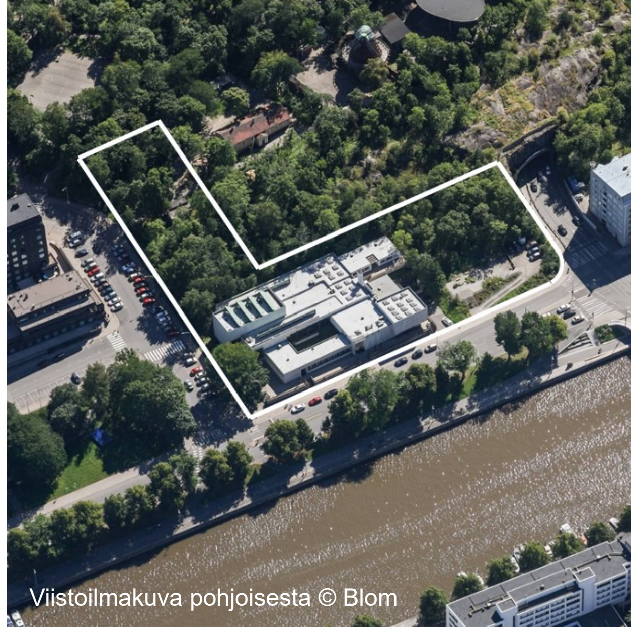
Viistoilmakuva pohjoisesta

Wäinö Aaltosen museo (WAM) on nykytaiteeseen keskittynyt taidemuseo, joka on valmistunut vuonna 1967. Wäinö Aaltosen museon peruskorjauksen ja laajennuksen tilatarveselvitys hyväksyttiin 18.6.2018 Kaupunginhallituksen kaupunkikehitysjaostossa. Tarveselvityksessä on selvitetty teknisten tarpeiden lisäksi Wäinö Aaltosen museon peruskorjaukseen liittyviä tulevaisuuden toiminnallisia tilatarpeita ja etsitty niihin ratkaisuvaihtoehtoja. Parhaillaan valmistellaan hankesuunnitelmaa ja tehdään kuntoarviota.