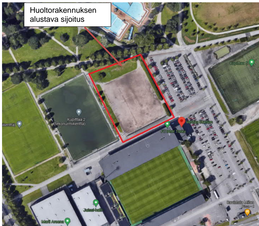
Kuva 1: Kohteen sijainti