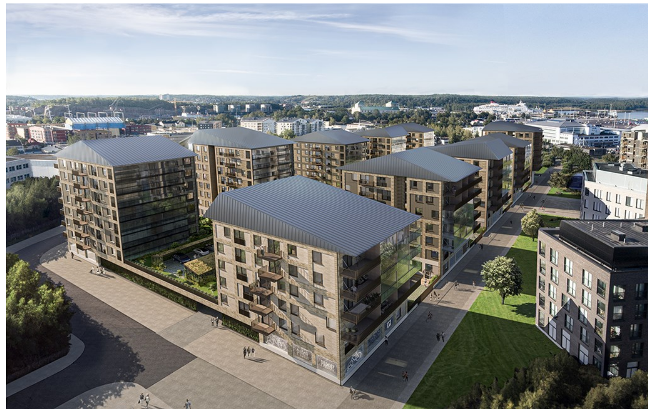
Kuva 3: havainnekuva viitesuunnitelmasta

Hanke ei käytännössä aiheuta uusia investointitarpeita kaupungille.