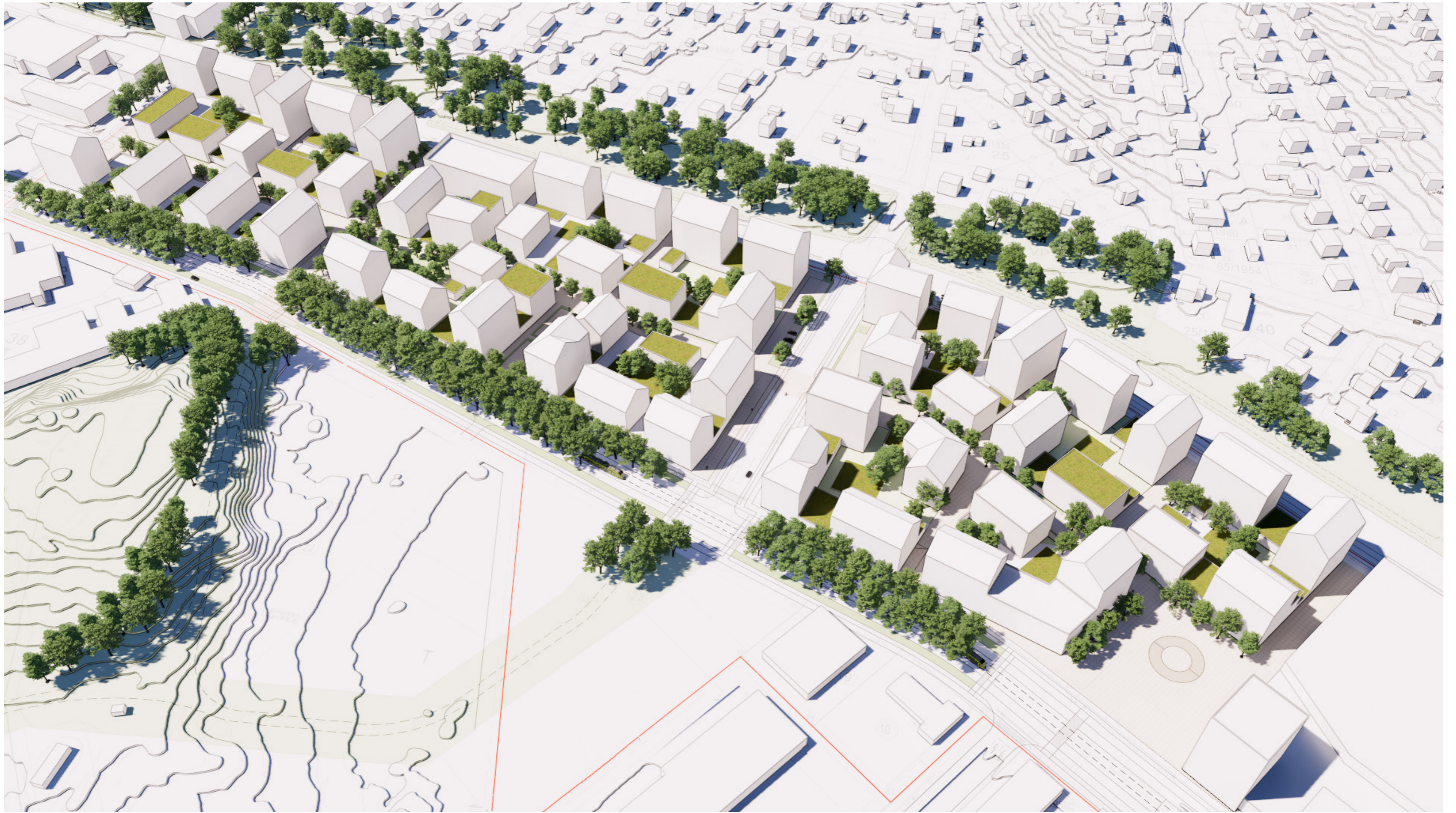
Näkymä etelästä asuinkorttelien suuntaan.