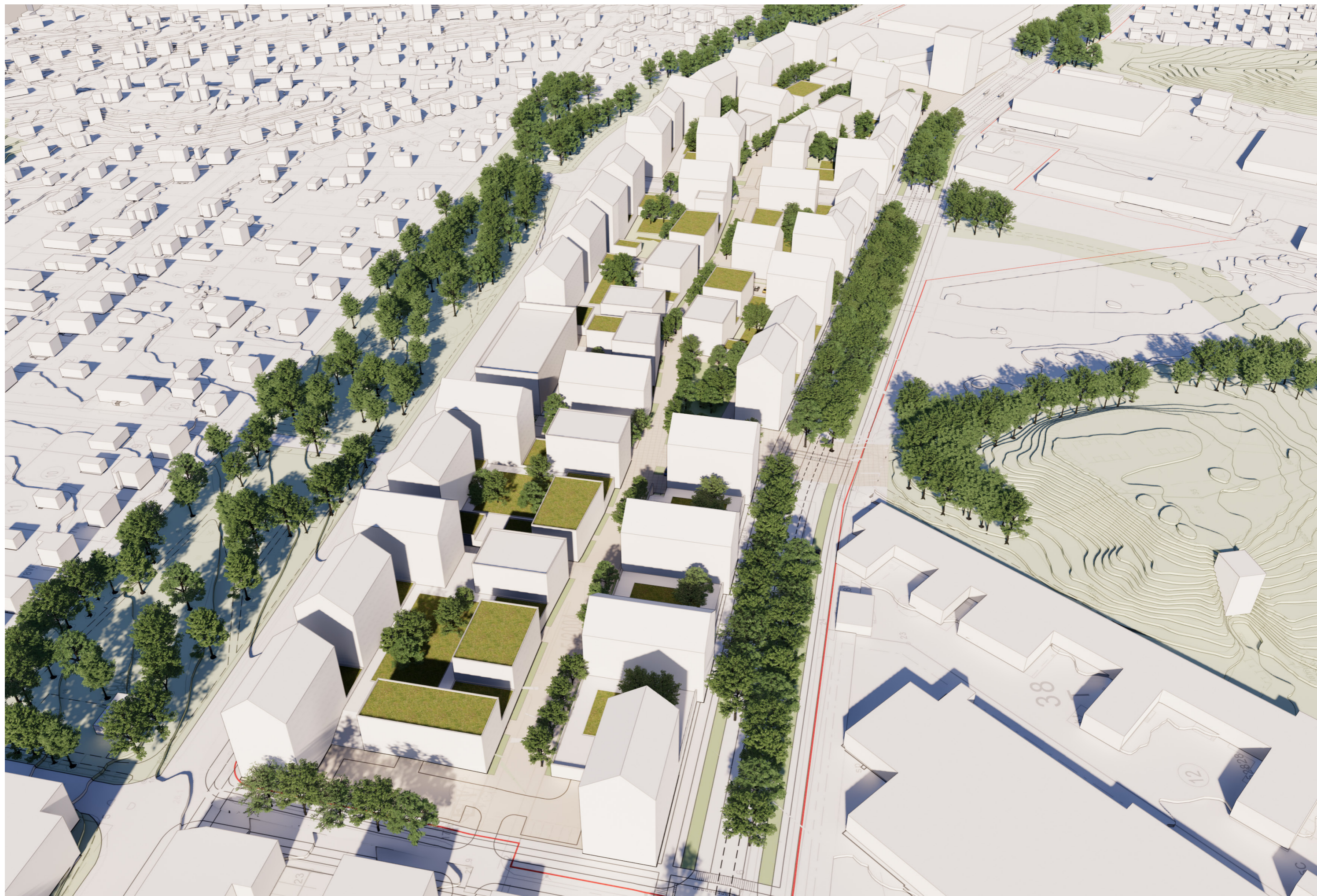
Näkymä lännestä asuinkorttelien suuntaan.