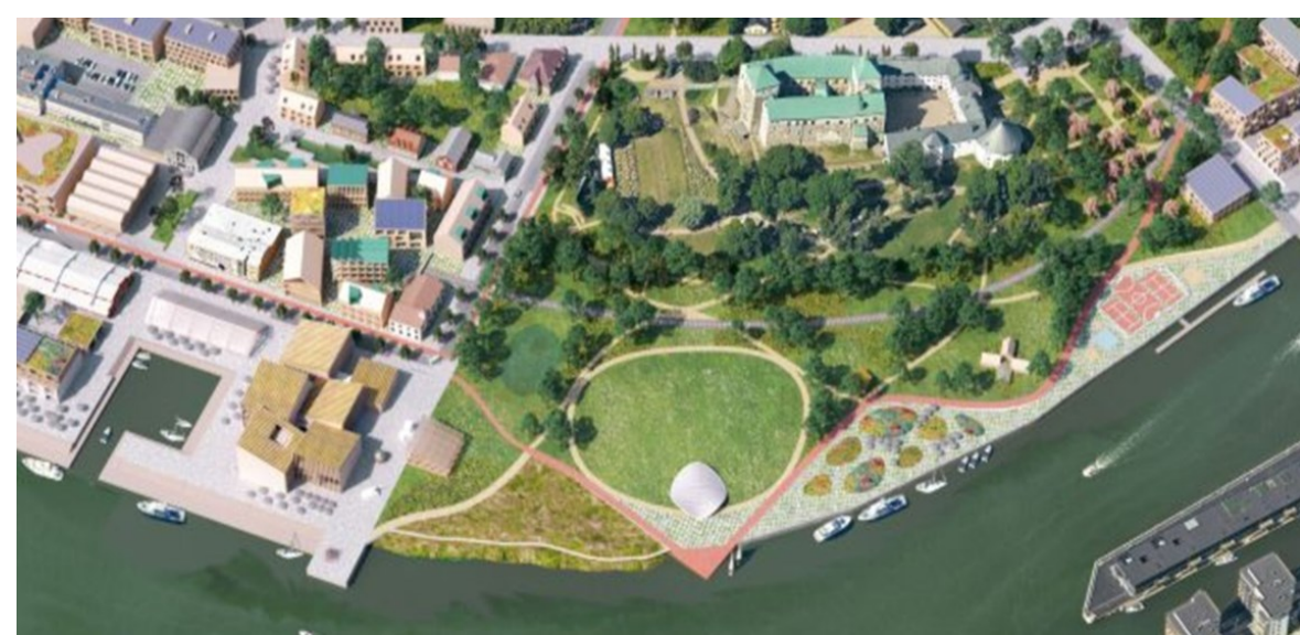
Turun Linnanniemen kansainvälinen ideakilpailu 1. Palkinto kolme palaa

Tehdyn esiselvityksen perusteella kaavoitus toteaa, että kaavahanke on Linnanniemi-nimisen maankäytön strategisen hankkeen mukainen ja se otetaan kaavoitusohjelmaan.