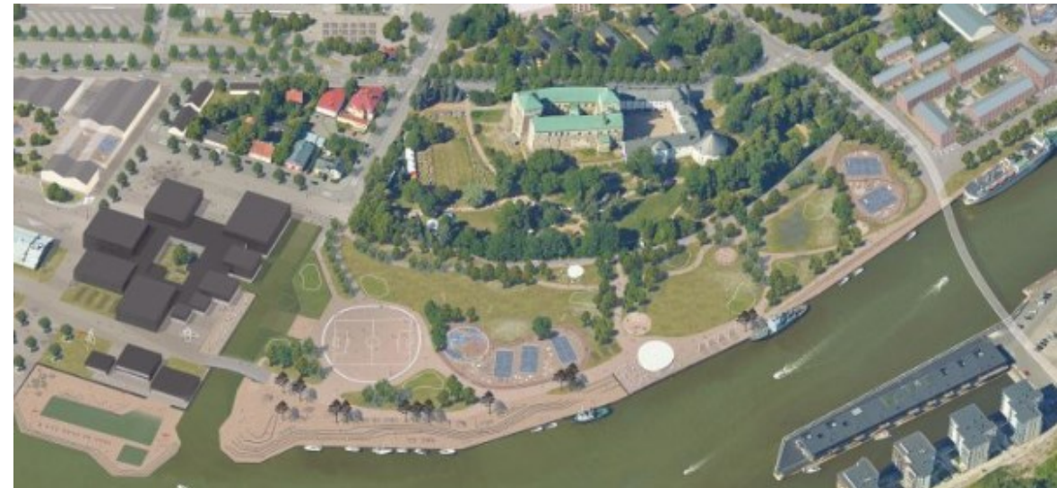
Turun Linnanniemen kansainvälinen ideakilpailu Lunastus Tides, ehdotuksen puistosuunnitelmaa arvostettiin