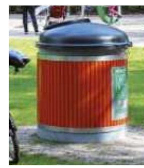
syväkeräysastia väri musta

Koordinaattijärjestelmät: Taso X,Y: ETRS-GK23 (EUREF-FIN) Korkeus Z: N2000