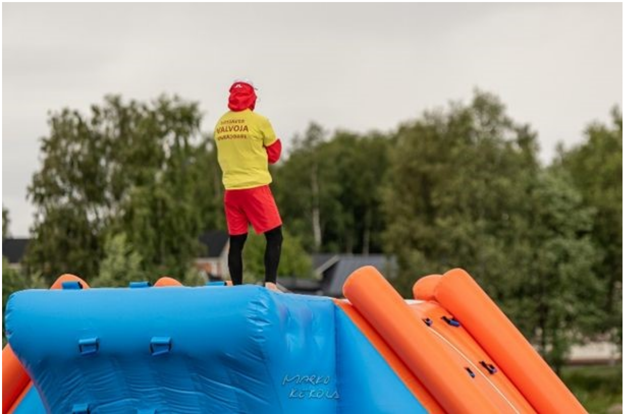
Uimavalvoja Oulun vesipuistossa