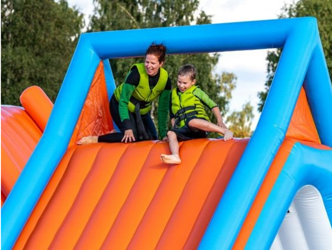
Äiti ja poika yhdessä Oulun vesipuistossa

Suunniteltu vesipuisto koostuu ilmatäytteisistä "esteistä" jotka muodostavat ns. kelluvan ninjaradan. Esteiden myötä vesipuisto on todella hauska, mutta samalla myös toiminnallinen. Parhaiten vesipuiston tunnelmaan pääset katsomalla nämä videot Oulun puistosta.