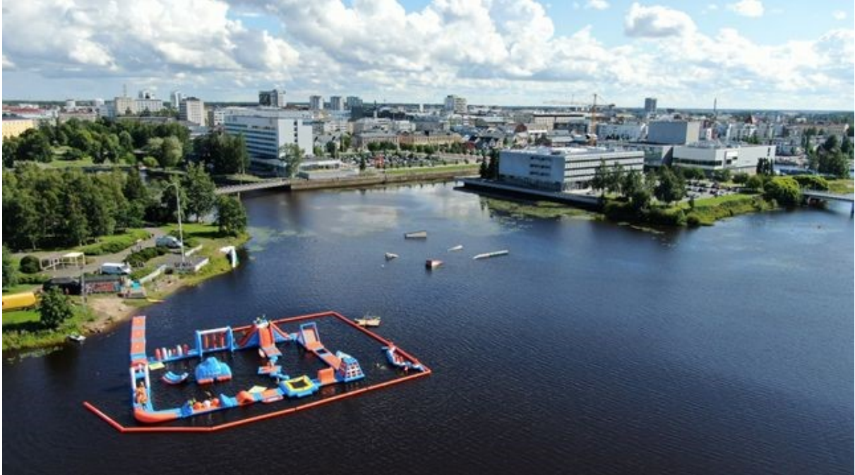
Vesipuisto Oulun Linnansaarella