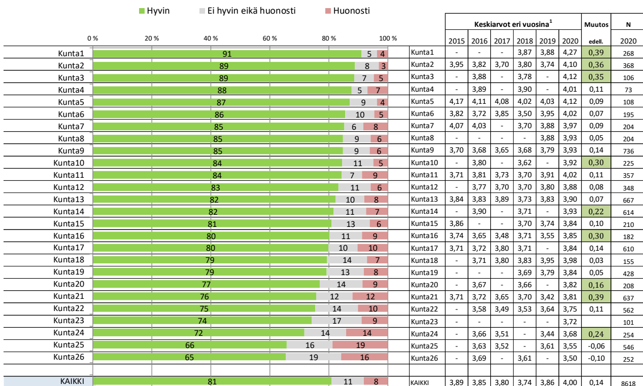
Kuvio 7. Miten hyvin KESKUSTAN KATUJEN PUHTAUS JA SIISTEYS on hoidettu