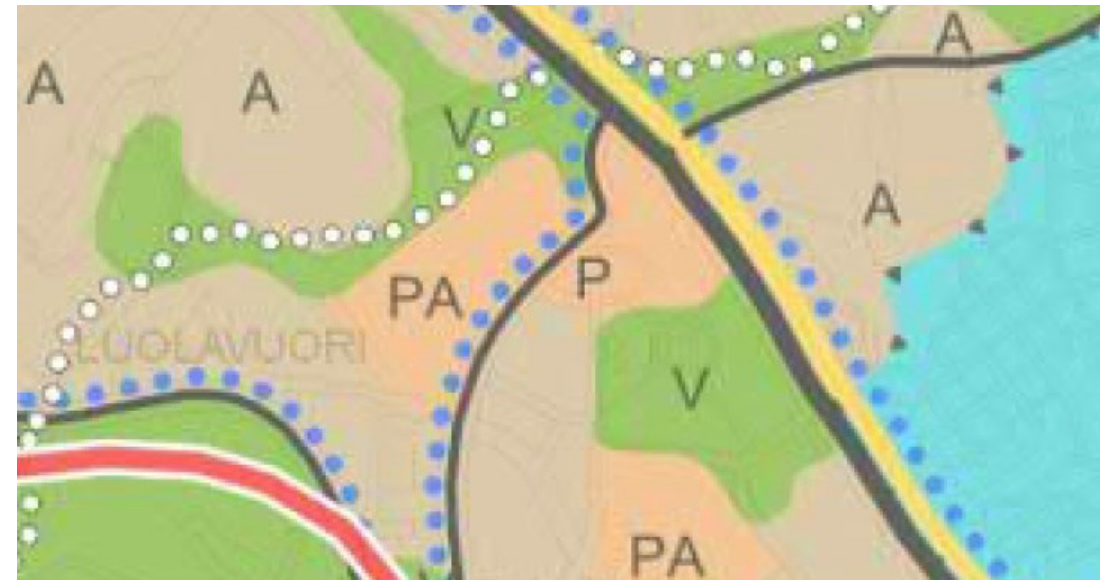
Ote yleiskaavan 2029 ehdotuksesta.