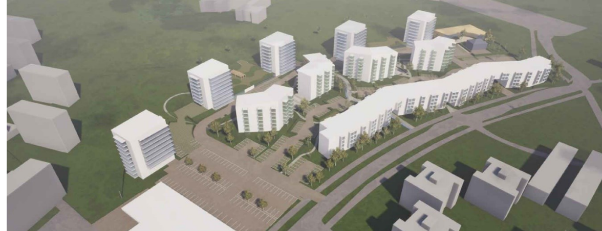
Ote alustavasta maankäyttösuunnitelmasta (Schauman Arkkitehdit Oy 9.6.2020).

Kaavanmuutosta pidetään kaupungin tavoitteiden mukaisena ja hankkeesta saavutettavat hyödyt nähdään haittoja suurempina. Suunnittelun yhteydessä tulee arvioida rakentamisen määrää, sijaintia ja sopivuutta ympäröivään maastoon ja kaupunkikuvaan sekä alueen viihtyisyyttä ja toimintojen ja asumismuotojen monipuolisuutta. On suotavaa säilyttää olemassa olevia puita, etenkin metsän reunalla ja Peltolantien varrella. Laajoja pysäköintikenttiä ja liiallista yksipuolisuutta tulee välttää, ja mahdolliset liiketilat on hyvä yhdistää muihin toimintoihin.