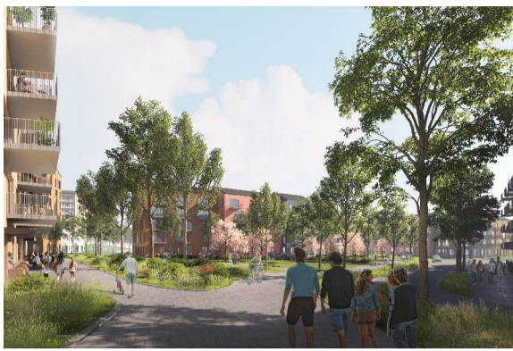
HAVAINNEKUVA HELLEMAANAUKIOLTA, ARKKITEHDIT MY OY