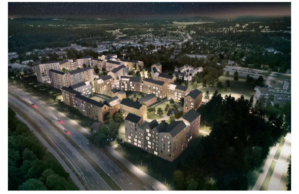
HAVAINNEKUVA UUDENMAANTIelta, ARKKITEHDIT MY OY