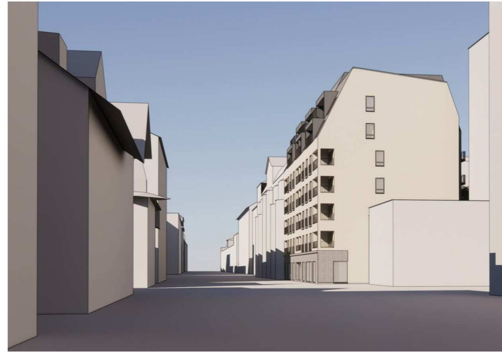
HAKIJAN LUONNOS/SIGGE ARKKITEHDIT 2022