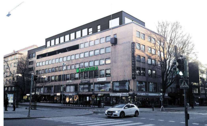
Havainnekuva Kestilänkulman korotuksesta (Schauman Arkkitehdit Oy, 9.4.2020)