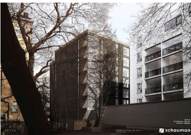
Havainnekuva Kristiinankatu 10a:n uudesta kerrostalosta (Schauman Arkkitehdit Oy, 9.4.2020)